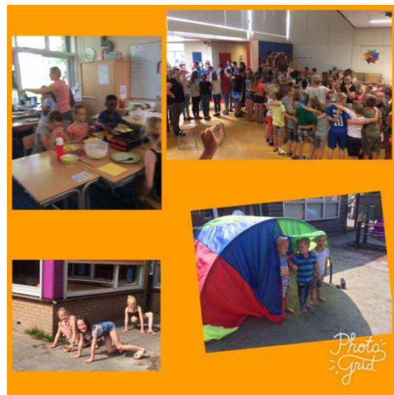
Juffen- en meestersdag