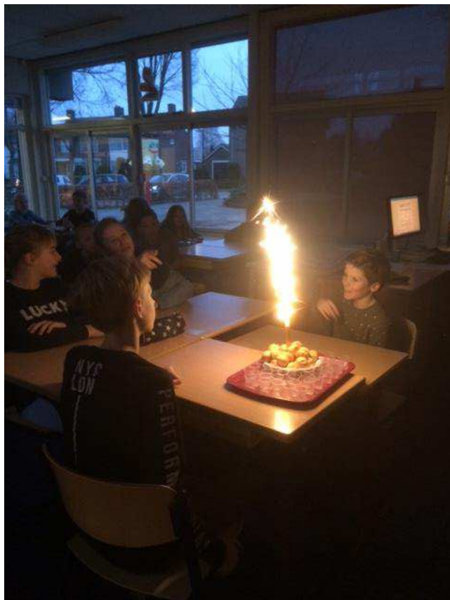
Met een nieuwjaarstoost zijn we 2018 goed begonnen. Dank je wel ouderaad voor het verzorgen hiervan.