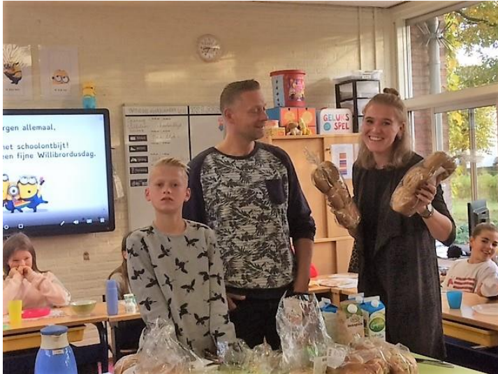
Schoolontbijt op Willibrordusdag