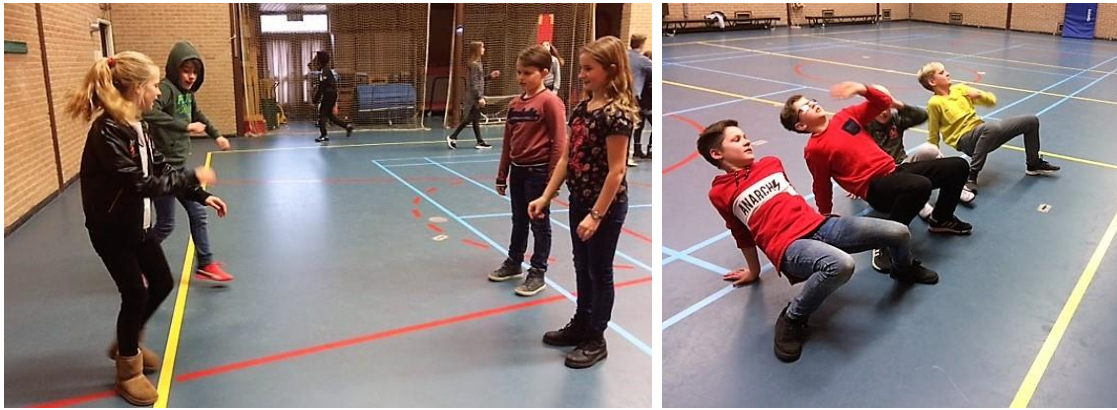
Groep 7 en 8 oefenen breakdance voor de dansvoorstelling

Een echte carnavalsoptocht was de opening van carnaval en het project Veilig in het verkeer.