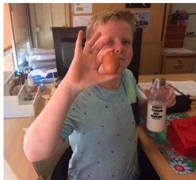
of met een lekker eitje.....