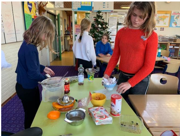
zelf frisdrank maakt.....