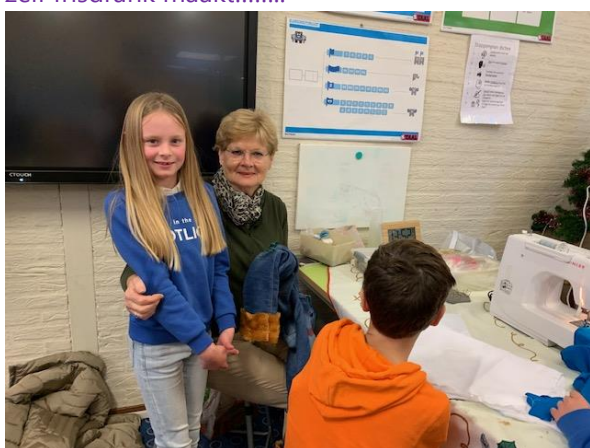
of zelf kleding.....

wat is er nu leuker dan met elkaar ontwerpen en ontwikkelen.