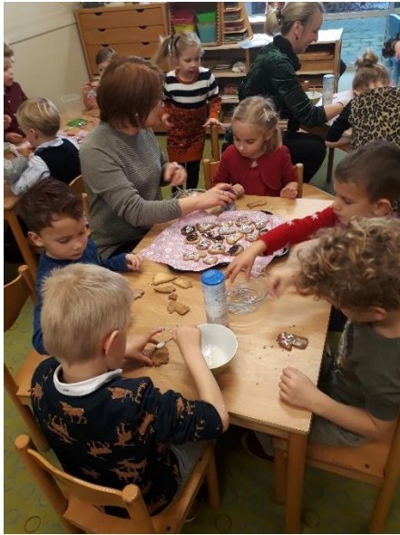
Of je nu koekjes bakt.....