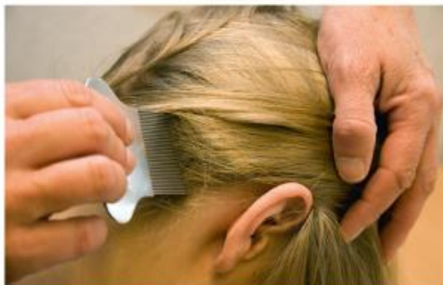
Kam het haar met een fijntandige kam boven een wit papier of de wasbak.

Er zijn de komende weken geen luizencontroles op school. Wij vragen u uw kind thuis regelmatig te controleren en indien nodig te behandelen. Mocht u neten of luizen bij uw kind vinden, dan graag een berichtje naar school. We kunnen dan andere ouders erop attenderen extra alert te zijn.